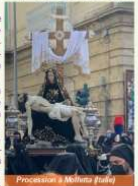
Procession à Molise (Italie)

Plus d’info sur les processions en Espagne: https://lepetjournal.com/