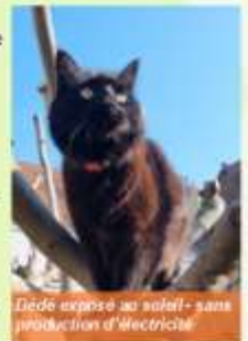
Dédé expose au soleil - sans production d’électricité